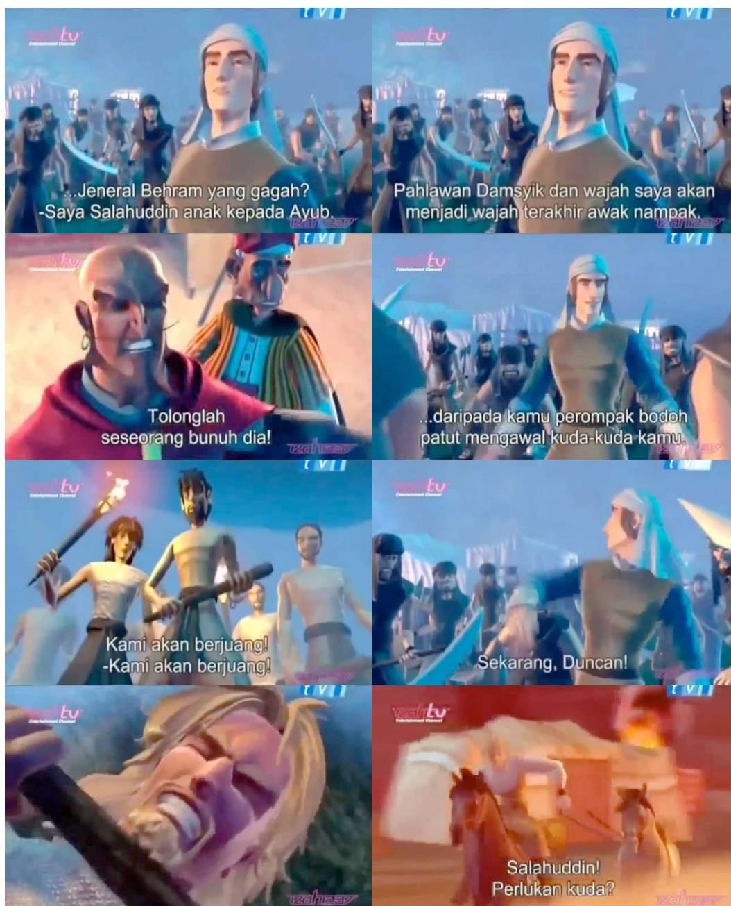
Frame berturutan 2: Saladin meminta Duncan untuk menolongnya untuk melarikan diri daripada penjara Jeneral Behram. (42:54-47:05 di Animated_Stories_of_Islam.nashbooky.com.mp4)

Babak ini juga menunjukkan betapa dangkalnya pemikiran Saladin apabila rancangannya untuk melarikan diri pada awalnya tidak berjaya. Kata-kata Saladin “Dan wajah saya akan menjadi wajah terakhir awak nampak!” kelihatan dangkal walaupun bertujuan untuk menarik perhatian Behram. Akibatnya, Saladin hampir dibunuh oleh perompak Behram. Babak ini menunjukkan penentangan yang dilakukan oleh pengarah terhadap perwatakan Salahuddin al-Ayubi yang berfikir dangkal.