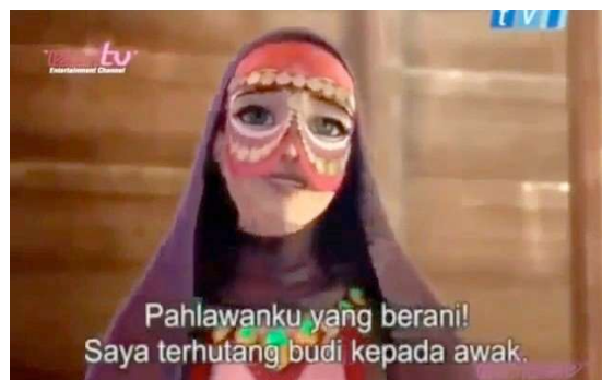
Frame 2: Anisa sebagai wanita misteri yang ingin mengahwini Saladin sekadar mempermainkan Saladin. (55:46 - 56:48 di Animated_Stories_of_Islam.nashbooky.com.mp4)

Watak eksistensi kedua yang diwujudkan oleh pihak produksi ialah Tarik, sahabat Saladin yang berperwatakan tergesa-gesa, suka berlawak jenaka, tidak berani mengambil risiko, dan selalu menasihati Saladin supaya tidak melibatkan diri dalam masalah. Dalam siri ini digambarkan Tarik tidak pandai berlawan menggunakan pedang namun sangat baik dalam memanah.