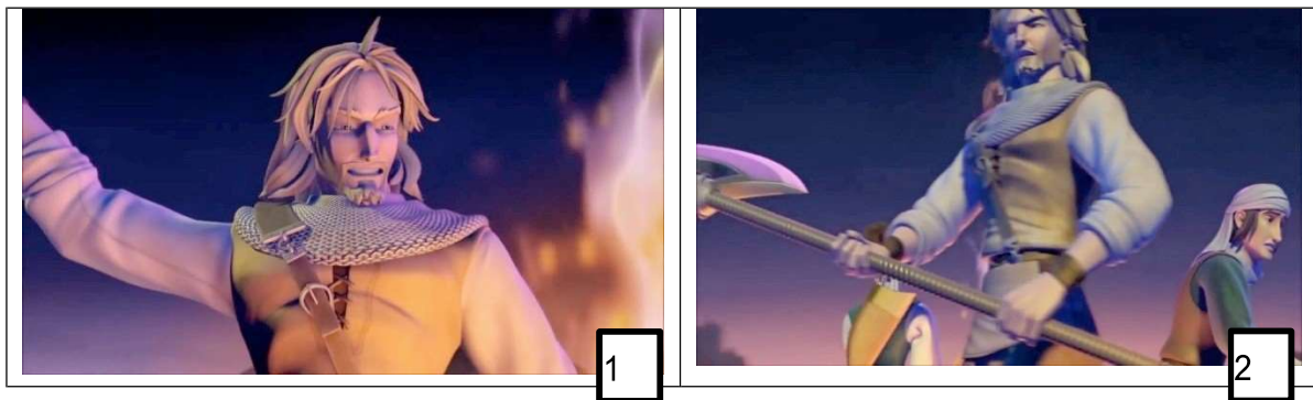
Frame 4 dan 5: Watak eksistensi Duncan dalam Saladin the Animated Series

Seterusnya, antara eksistensi yang dilakukan oleh pihak penerbit ialah watak Duncan. Kehadiran watak Duncan adalah amat mengelirukan kerana dia ialah bekas tentera Salib atau dalam siri animasi ini dikenali sebagai tentera Reginald, dan bekas tentera Salib ini telah disatukan dengan pemimpin tentera Islam yang mengeluarkan tentera Salib dari bumi Mesir. Dalam Saladin the Animated Series , selain Tarik, Duncan juga merupakan teman rapat Saladin, dan perkenalan mereka bermula sewaktu penangkapan Saladin untuk dijadikan hamba. Duncan menyelamatkan Saladin sewaktu melarikan diri dari penjara Behram (siri kedua: Marauders ). Pihak produksi telah menjadikan watak Duncan lebih terserlah berbanding Saladin. Duncan ialah watak yang sentiasa ada bersama Saladin, dan sentiasa melindungi Saladin. Watak ini juga diwujudkan bagi melampaui watak utama, dengan berperwatakan seperti seorang hero.