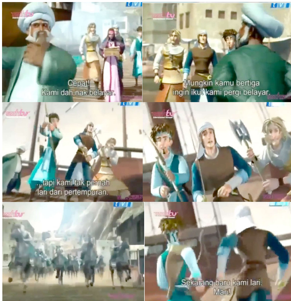
Frame berturutan 1: Saladin, Tarik dan Duncan mendapat tugas untuk menghantar seorang wanita ke sebuah kapal. Mereka melarikan diri ke atas kapal. (50:24-54:54 di Animated_Stories_of_Islam.nashbooky.com.mp4)

Dalam babak ini Saladin dan rakan-rakannya melarikan diri ketika berdepan dengan tentera Reginald yang ramai. Pengarah telah membuat penguguran dari segi sifat Salahuddin al-Ayubi yang berani menentang musuh dan berani berdepan dengan musuh kepada takut berdepan dengan musuh. Saladin dan rakan-rakannya berlari menyelamatkan diri dalam sebuah kapal yang dikendalikan oleh Kapten Sina. Dalam buku The Life of Saladin , Ibnu Shaddad menulis dalam biografi Sultan Salahuddin bahawa: