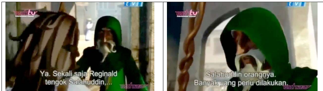
Frame 6 dan 7: Watak eksistensi: Omar dalam Saladin the Animated Series

adalah orangnya, pahlawan yang ditunggu-tunggu. Maka, banyak perkara yang perlu dilakukan oleh Omar untuk persediaan Saladin sebagai pahlawan tersebut.