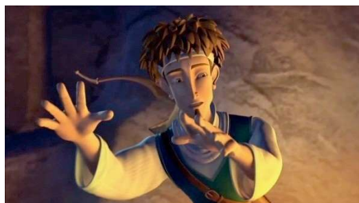
Frame 3: Watak eksistensi: Tarik, Saladin the Animated Series