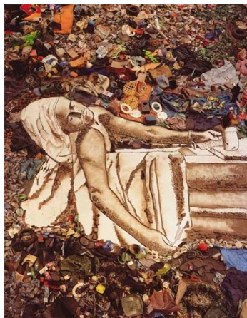
Figure 3: Marat (Sebastião) (Vik Muniz, 2008).

Artis Brazil yang bernama Vik Muniz ini adalah pengkarya yang memperjuangkan pergerakan seni dari bahan kitar semula. Beliau pakar dalam menghasilkan semula karya dengan bahan kitar semula dan bahannya terdiri dari sampah, majalah, wayar, potongan teka-teki dan juga habuk. Filem, Waste Land adalah sebuah dokumentari mengenai projek Muniz, yang berlangsung selama tiga tahun di gurun paling besar di dunia iaitu Jardim Gramacho di Rio de Janeiro. Dalam projek ini, Muniz bekerjasama dengan seorang pemungut yang mengumpulkan sampah untuk artis. Pada akhir projek, artis menjual semua gambar semasa acara lelong, dan menyumbangkan hasilnya kepada pemungut yang mengambil bahagian dalam projek tersebut.