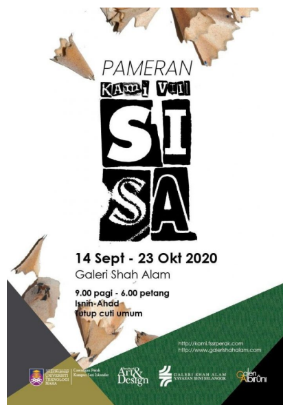
Figure 1: Pameran KAMI 8: SI + SA (Galeri Shah Alam, 2020)

Banyak peristiwa pahit dan manis yang menggamit selama menceburkan diri dalam bidang seni. Sebagai pelajar tentunya kenangan bersama rakan-rakan dan tenaga pensyarah serta pengalaman menyiapkan kerja kursus dan projek-projek seni sentiasa menjadi cerita gurauan dan nasihat untuk anak-anak didiknya kini. Bagi yang pernah mengajar pula, pengalaman di Shah Alam banyak mencorakkan kaedah pengajaran dan proses penyampaian masing-masing. Setiap perjalanan yang memabitkan kedua-dua lokasi ini akan menjadi sebahagian kisah hidup individu dalam meneruskan hidup bersama sisa kenangan yang lalu.