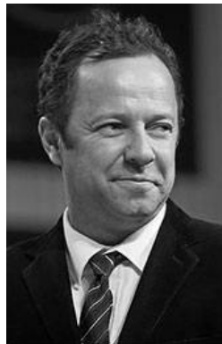
Figure 2: Vik Muniz (The Art Story, 2019).

Pelbagai karya seni yang senantiasa menjadi rujukan kepada para pengkarya lebih-lebih lagi karya seni yang menggunakan medium baharu dalam menampilkan eksplorasi bahan seperti kitar semula, sisa buangan mahupun barangan terpakai. Ianya merupakan sebuah perkongsian yang unik oleh pengkarya kepada para penonton. Karya-Karya ini selalunya menjadi rujukan sebagai karya seni yang mempunyai nilai kesedaran terhadap alam semulajadi.