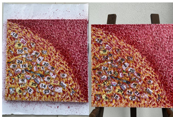
Figure 5: Proses pembuatan (Khairi Karim, 2020)

Di sini, Tuhan seolah-olah menguji manusia untuk merasa kehidupan orang sekeliling dan mengajar manusia untuk sentiasa melihat persekitaran bahwa langit tidak selalunya cerah dan beringatlah setiap apa yang dilakukan.