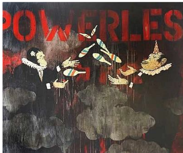
Rajah 1.1: Contoh karya yang mengengahkan konsep sindiran di dalam penghasilan karya. Samsudin Wahab “ Powerless ”, 2008, Media campuran atas kanvas, 83 cm x 152 cm.

Penulisan ini bertujuan untuk menzahirkan ideologi politik dalam budaya masyarakat dalam bentuk pernyataan sindiran kepada bentuk visual. Isu yang diketengahkan amat popular dikalangan masyarakat, bukan sekadar di Malaysia, malah seluruh dunia. Penyampaian sindiran terhadap politik melalui karya seni adalah untuk mengenalpasti, meneliti dan menilai aspek-aspek politik sezaman. Selain itu juga, aspek nilai estetika turut diberi penekanan dalam penghasilan karya.