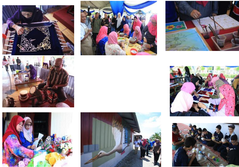
Gambar 2: Jalinan kepakaran Produk Universiti & Komuniti

Penglibatan pelajar dan ahli akademik universiti melalui program masing-masing merupakan elemen utama dalam menjayakan maksud kertas kerja ini. Penglibatan pelajar amat diutamakan dan penting kerana ianya boleh dimanfaatkan melalui aspek berikut: