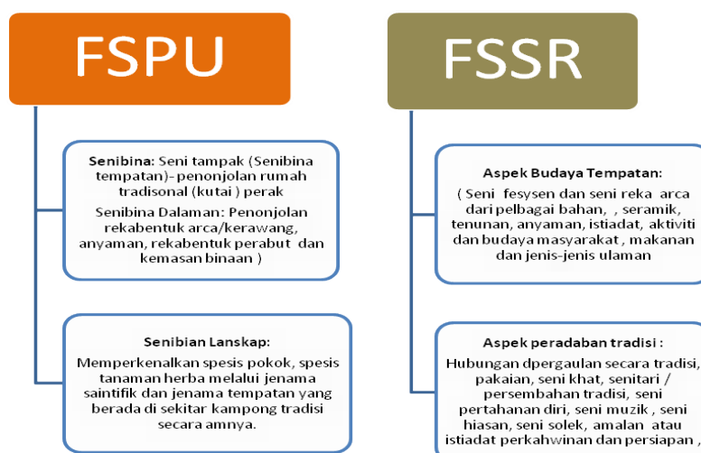
Rajah 2: Keupayaan dan peranan Universiti yang boleh diterjemah bersama komuniti dan agensi pelancongan

Integrasi akademik dalaman universiti terutamanya dari Fakulti Senibina Perancangan dan Ukur (FSPU) dan Fakulti Senilukis dan Seni Reka (FSSR) mempunyai potensi tersendiri dalam penyampaian ilmiah secara teori dan praktikal. Maklumat tersebut boleh dikaitkan dengan budaya setempat yang boleh dijalinkan bersama komuniti dan agensi pelancongan dalam memperkenalkan budaya dan kehidupan masyarakat di negeri Perak kepada pelancong atau pelawat luar dan dalam negeri.