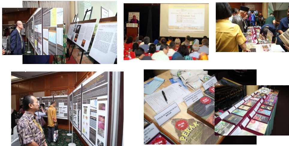
Gambar 1: Universiti sebagai transit/platfom Informasi pelancong