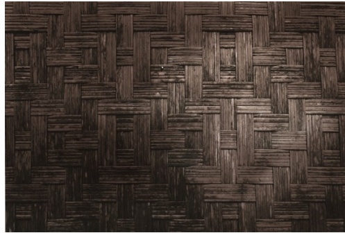
Figure 2: Fotografi Abstrak Seni Anyaman Dinding Rumah.