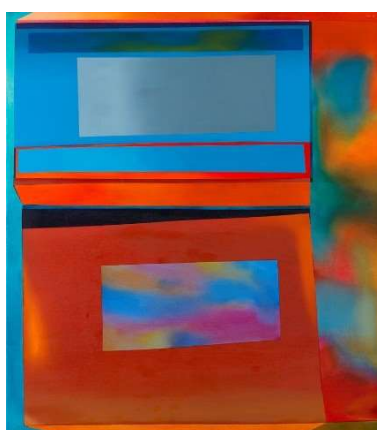
Rajah 6: Black (Remix) oil on canvas, 2007

Karya ini juga lebih nampak tidak tersusun seperti karya Piet yang mana ianya seperti melanggar reka bentuk karya tetapi masih lagi nampak terancang. Pemilihan warna ini juga lebih memberi rasa emosi. Walaupun warna panas digunakan, namun kita masih lagi mahu melihat ke arah warna natural disebabkan sentuhan warna yang boleh dikatakan setiap hari kita melihatnya. Ianya sangat dekat dengan jiwa manusia kerana secara fitrahnya mata kita sukakan warna yang lembut dan selesa dipandang.