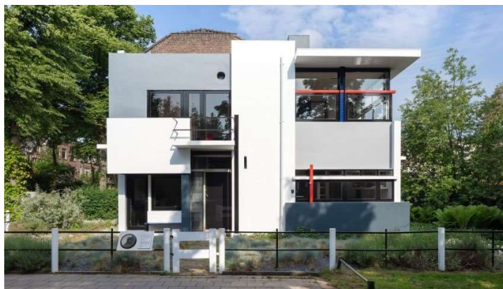
Rajah 3: Rietveld Schroder House, 1924

Beliau telah membangunkan Rietveld Schroder House di Utrecht pada tahun 1924 dengan mengeluarkan semua hiasan yang tidak diperlukan bagi menyerlahkan elemen kontemporari.