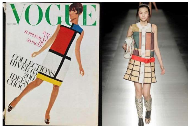
Rajah 2: Majalah Vogue, 1965

Karya beliau telah berubah dari masa ke semasa sehingga beliau menghasilkan karya yang sangat minimalis dengan penggunaan warna-warna prima contohnya karya Composition II Red, Blue and Yellow pada tahun 1930. Karya beliau telah memberi kesan terhadap budaya dan kita dapat melihat bagaimana pengaruh karyanya berpanjangan yang mengubah gaya seni, muzik, seni bina dan fesyen hingga kini. Ini dapat dilihat dengan jelas melalui majalah Vogue 1965 yang mana hasil rekaan pakai pada majalah tersebut telah menggunakan hasil karya Piet Mondrian.