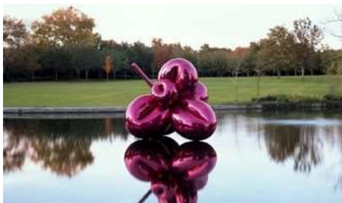
Rajah 4: Flower (Magenta), 1995-2000

Pada ketika ini, warna prima yang terdiri daripada warna merah, biru, kuning telah banyak digunakan di dalam karya catan. Seniman telah melangkaui penggunaan warna ini melebihi warna prima dan campuran daripada warna prima. Hal ini kerana, penghasilan warna yang tidak menggunakan asas warna prima telah banyak dikeluarkan dan digunakan dalam pelbagai jenis produk, fesyen, kenderaan, bangunan dan sebagainya. Contohnya warna chartreuse iaitu warna antara kuning dan hijau yang telah banyak digunakan pada produk seperti kasut, baju, pembakar roti dan sebagainya. Jika pada 20 tahun yang lalu penggunaan warna kontemporari hanyalah digunakan pada alat kecemasan seperti baju keselamatan, tanda kecemasan dan lain-lain, tetapi pada ketika ini kebanyakan seniman sudah mula menggunakan warna-warna ini di dalam penghasilan karya. Contohnya karya Jeff Koons yang bertajuk Ballon Flower (Magenta) , (1995-2000). Beliau adalah seorang artis kontemporari yang paling berjaya pada hari ini di mana beliau mengabadikan dirinya di dalam karya melalui imej dengan pendekatan karya yang menggunakan warna kontemporari. Jeff Koons menterjemah karya beliau dengan penggunaan subjek mainan dan hadiah melalui arca dan catan dengan warna yang brilliant dan saiz yang berskala besar.