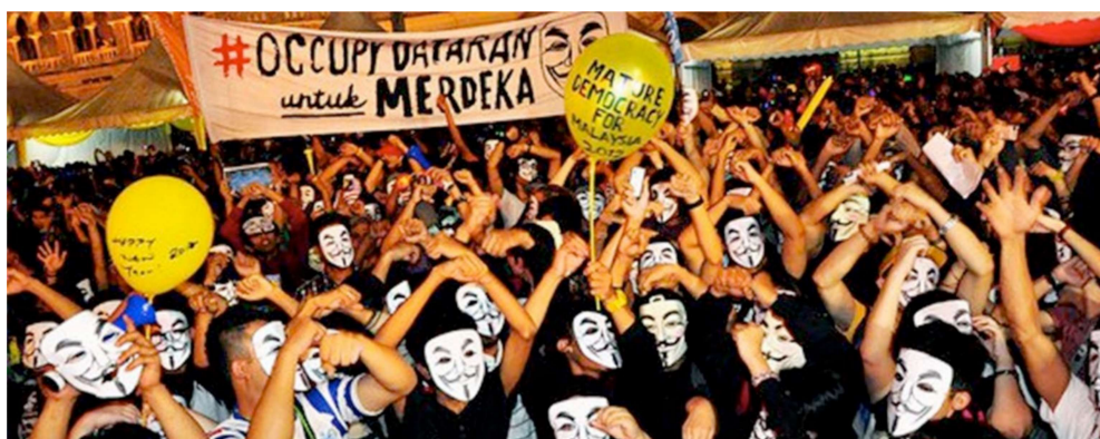
Gambar 4: Penggunaan topeng Guy Fawkes oleh peserta- peserta Perhimpunan Bersih di Kuala Lumpur.

Perkara yang sama juga turut berlaku di negara kita Malaysia. Sejak beberapa tahun kebelakangan ini, kita sering melihat beberapa siri demonstrasi secara aman memprotes skandal-skandal melibatkan kerajaan yang dirasakan zalim, korup dan juga menekan rakyat. Sebagai contoh, beberapa siri Perhimpunan Bersih yang ditunjangi oleh parti-parti pembangkang dan juga NGO pro-pembangkang telah dilancarkan dan telah mendapat sambutan yang hangat daripada rakyat. Mereka yang turut sama dalam perhimpunan dan demonstrasi jalanan ini juga menggunakan topeng Guy Fawkes ini sebagai salah satu cara atau kaedah untuk menggambarkan ketidakpuasan hati mereka. Senario ini terbukti melalui beberapa gambar semasa perhimpunan tersebut yang diambil oleh penyelidik melalui internet seperti dipaparkan di bawah.