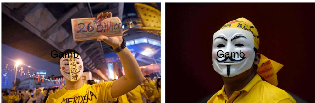
Gambar 2 & 3: Aksi peserta Perhimpunan Bersih yang mengenakan topeng Guy Fawkes di Kuala Lumpur.

Topeng berwajah Guy Fawkes ini akhirnya menjadi satu ikon popular di seluruh dunia dan menjadi satu imej visual bagi menggambarkan penentangan terhadap penyelewengan- penyelewangan yang dilakukan oleh kerajaan atau parti-parti pemerintah di mana-mana negara. Majalah Times (2011) menyifatkan topeng ini telah terjual sebanyak ratusan ribu unit menjadi top selling di laman web Amazon.com .