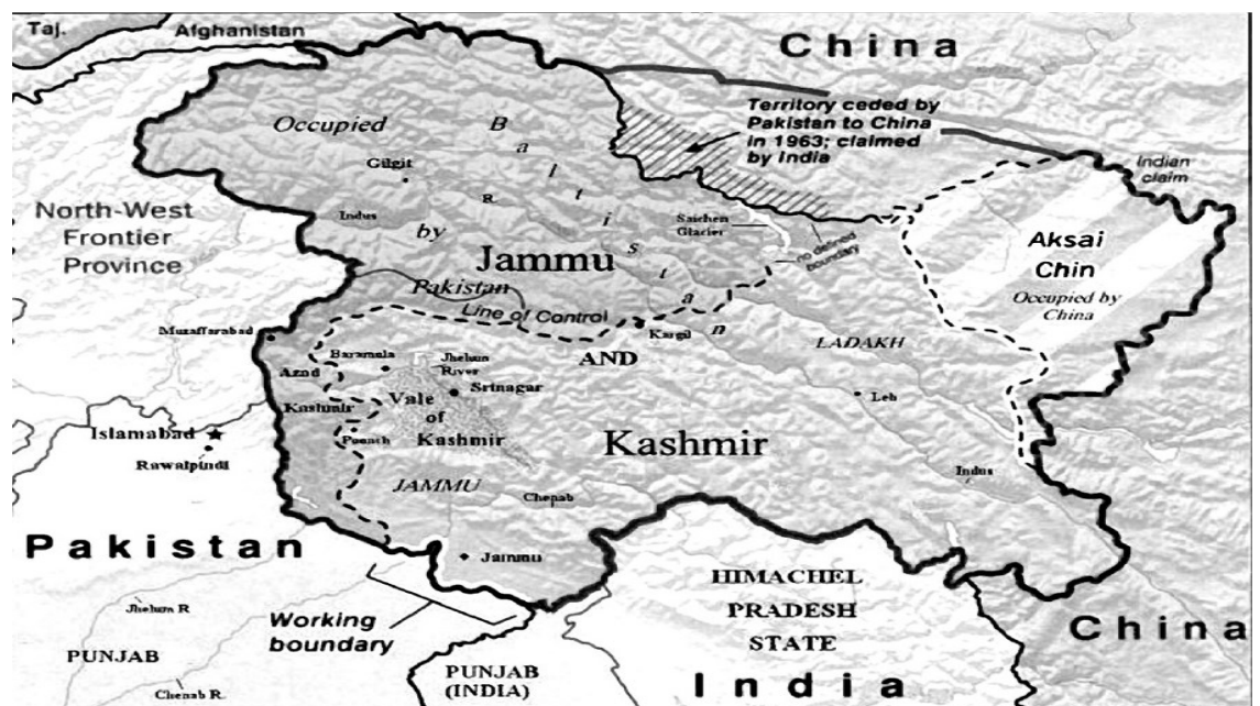
Peta 1: Wilayah Kashmir yang telah dibahagikan kepada tiga buah negara