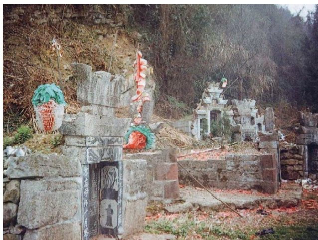
Gambar 2: Artefak Cina Kuno Berupa Makam (Fisher, Mary Pat and Rinehart, 2017).

Tao merupakan manifestasi substansi fisik-spiritual yang menghasilkan diri pribadi ( chi ). Inti dari ajaran Taois adalah gagasan tentang Dao : sesuatu yang tidak dapat disebutkan namanya; sesuatu yang nyata selamanya; konsep dasar yang tidak dapat didefinisikan; realitas mistis yang tidak bisa ditangkap oleh pikiran (Fisher, Mary Pat and Rinehart, 2017). Pada bagian ini, Fisher dan Rinehart memberikan interpretasi lain tentang karakter Tao , yang diwujudkan dalam bentuk chi , serta inti ajaran Taois yang menasar kepada objek tentang sesuatu yang tidak dapat disebutkan namanya—interpretasi ini terjadi karena Lao-tzu tidak menyebutkan nama khusus pada objek yang dimaksud. Beranjak dari konsep chi , Fisher dan Rinehart juga menunjukkan keberadaan mode energi yin-yang sebagai simbol Tao , yang bermakna, dualisme kehidupan dalam diri manusia (terang-gelap, lelaki-perempuan, lembut-tegas) di mana ada titik kecil sebagai puncak tertinggi putaran kehidupan (Fisher, Mary Pat and Rinehart, 2017).