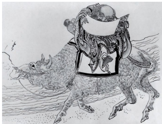
Gambar 1: Lao-dzu, Filsuf yang Menggagas Ajaran Taoisme.

Pembahasan Taoisme terhubung pada Lao-tzu (Laozi atau Laodze, namun demi memudahkan pembahasan penulis menggunakan nama Lao-tzu), filsuf yang mengagas konsep Tao ; kitab klasik Tao-te Ching (disebut juga Dao De Jing dan Zhuang Zi , namun demi memudahkan pembahasan, penulis menggunakan nama Tao-te Ching ); serta perjalanan sejarah dan praktik keagamaan. Beranjak dari ketiga aspek ini, kita akan bisa mendapatkan karakter Taoisme sebagai agama kawasan dari Tiongkok.