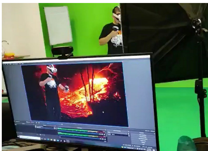
Gambar 4 Pendidikan 4.0: Revolusi Alat Teknologi

Semasa revolusi perindustrian 4.0, projektor, animasi atau rakaman audio dan video definisi tinggi, capaian internet, dan struktur platform penghasil fizik pencahayaan digabungkan untuk mencipta teknologi yang mempunyai nilai interaktif dan menarik. Pelbagai jenis bahan multimedia kini boleh dihasilkan menggunakan gabungan beberapa alat teknologi. Sebagai contoh, penghasilan hologram juga telah digunakan sebagai salah satu medium dan alat bantu mengajar di dalam bilik darjah kerana keupayaannya yang terkenal untuk menarik minat pelajar dan menyampaikan maklumat dengan berkesan (Ramlie et al, 2020; Ramachandiran et al., 2019).