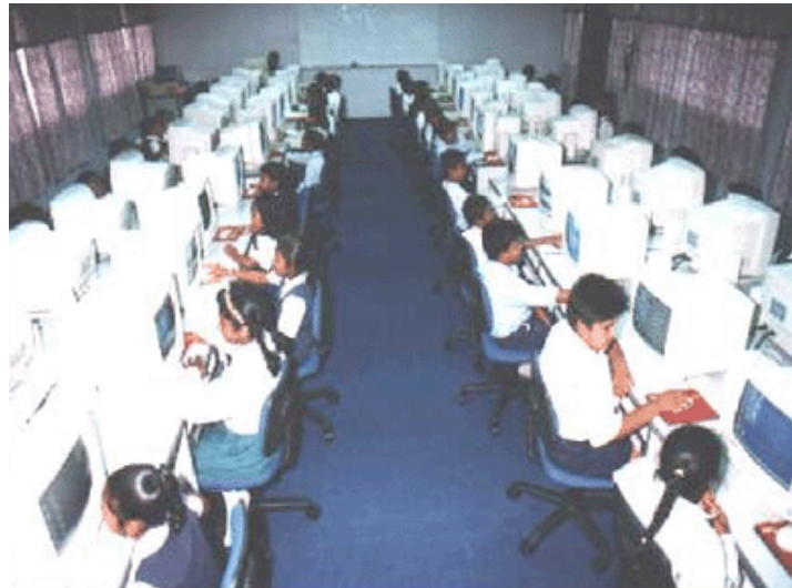
Gambar 2 Pendidikan 2.0: Pembelajaran berasaskan komputer

(Gerstein, 2014). Kaedah flipped classroom juga merupakan teknik yang digunakan dalam sistem pendidikan 2.0 yang menggabungkan pembelajaran di alam nyata dan alam maya (Kurup & Hersey, 2013).