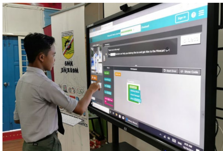
Gambar 3 Pendidikan 3.0: Alat Teknologi Smart Board

Kewujudan internet merupakan faktor utama pembangunan dalam industri pendidikan. Pendidikan 3.0 membawa lebih banyak perubahan berbanding era pendidikan sebelumnya. Platform teknologi diperkenalkan, dan peranan guru diubah menjadi fasilitator (Gerstein, 2014). Dengan adanya platform maya, pelajar boleh memilih subjek yang ingin dipelajari dan menetapkan objektif pembelajaran mereka sendiri sambil dibimbing oleh guru. Dalam era pendidikan 3.0, lebih banyak penekanan diberikan kepada kaedah pembelajaran yang menghubungkan manusia dari seluruh dunia untuk berkongsi pengetahuan dan mencipta pengetahuan baharu (Gerstein, 2014; Watson et al., 2015). Sejak abad ke-20, papan putih interaktif sebahagian besarnya telah menggantikan papan putih tradisional (Tan et al., 2018). Era ini menggambarkan zaman digital, apabila pelajar mula belajar menggunakan komputer. Beberapa platform digunakan sebagai alternatif kepada pembelajaran pelajar (Wang et al., 2012). Pelajar boleh belajar pada bila-bila masa dan di mana sahaja mereka mahu dengan menggunakan platform terbuka seperti ini. Pelajar juga terlibat secara aktif dalam proses pembelajaran apabila mereka mula berinteraksi dengan rakan-rakan mereka untuk mempelajari lebih lanjut.